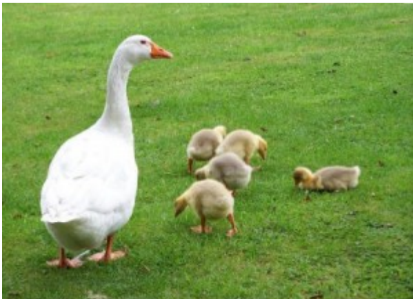
GĘŚ Z GĘSIETAMI