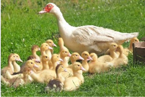
KACZKA Z KACZĘTAMI